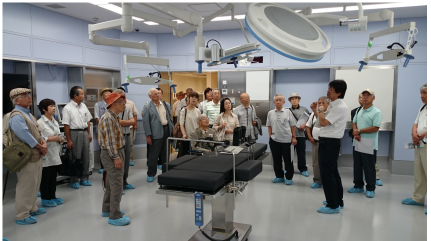
【写真】3階の手術室で事務局長から説明を受ける参加者

「市立ひらかた病院」の概要 アクセスは、枚方市禁野本町2-14-1。電話072-847-2821 FAX072-847-2825。